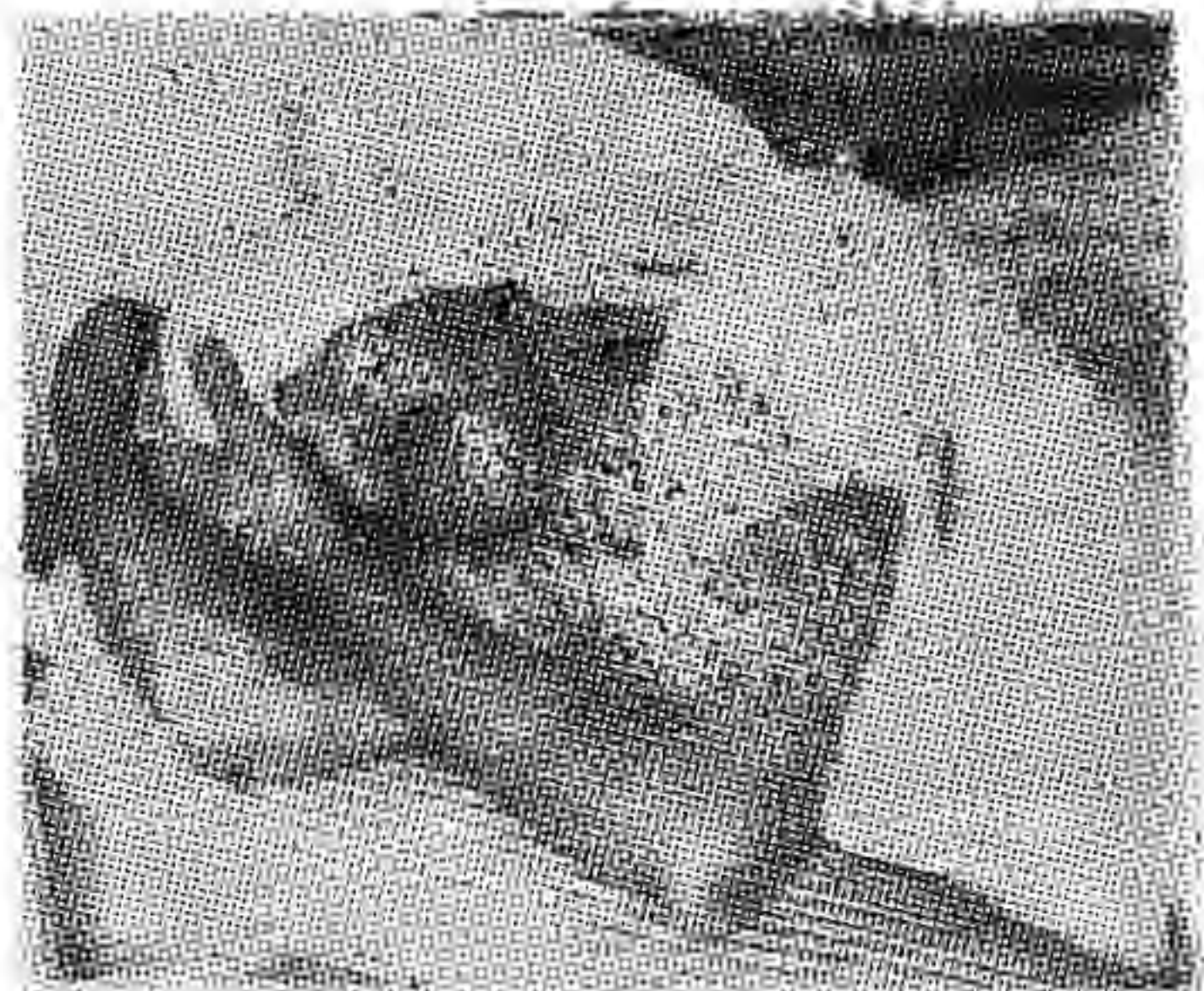
MIENTRAS LOS MILITARES SOLDADOS CAEN ABATIDOS, SUS OFICIALES SE ENRIQUECEN A COSTA DEL JUERO

ESTE SOLDADO ES TAMBIEN UNA VICTIMA DEL 10 DE MARZO