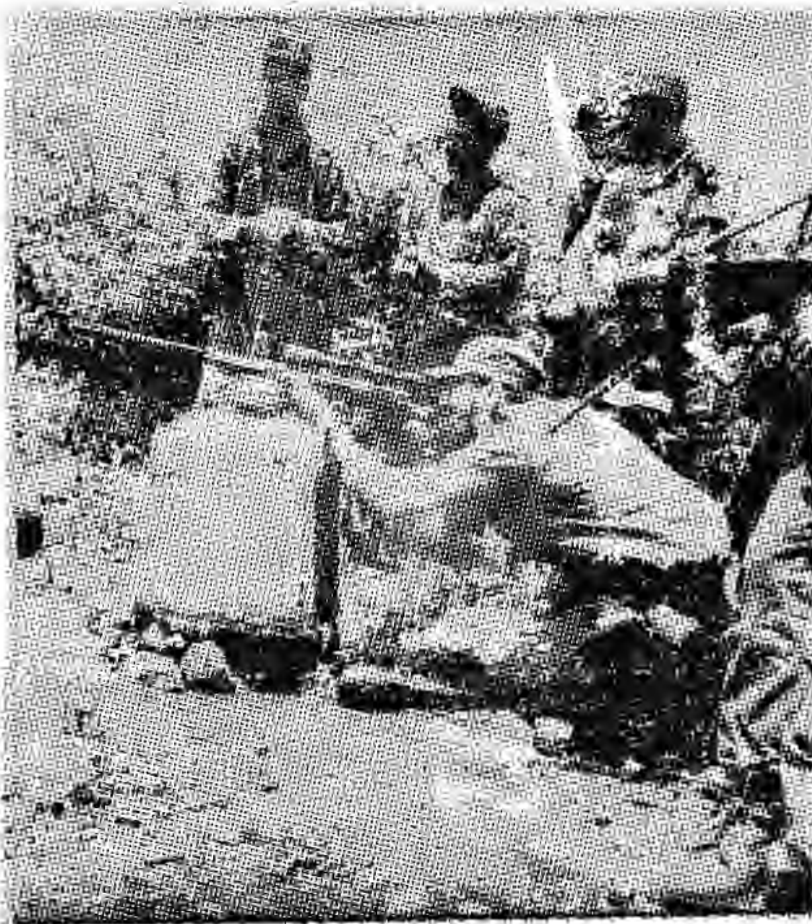
FIDEL CASTRO, CON SU RIFLE DE MIRA TELESCOPICA, DA INSTRUCCIONES A UN GRUPO DE COMBATIENTES, DIAS ANTES DE LA TRIUNFAL "OPERACION UVERO"