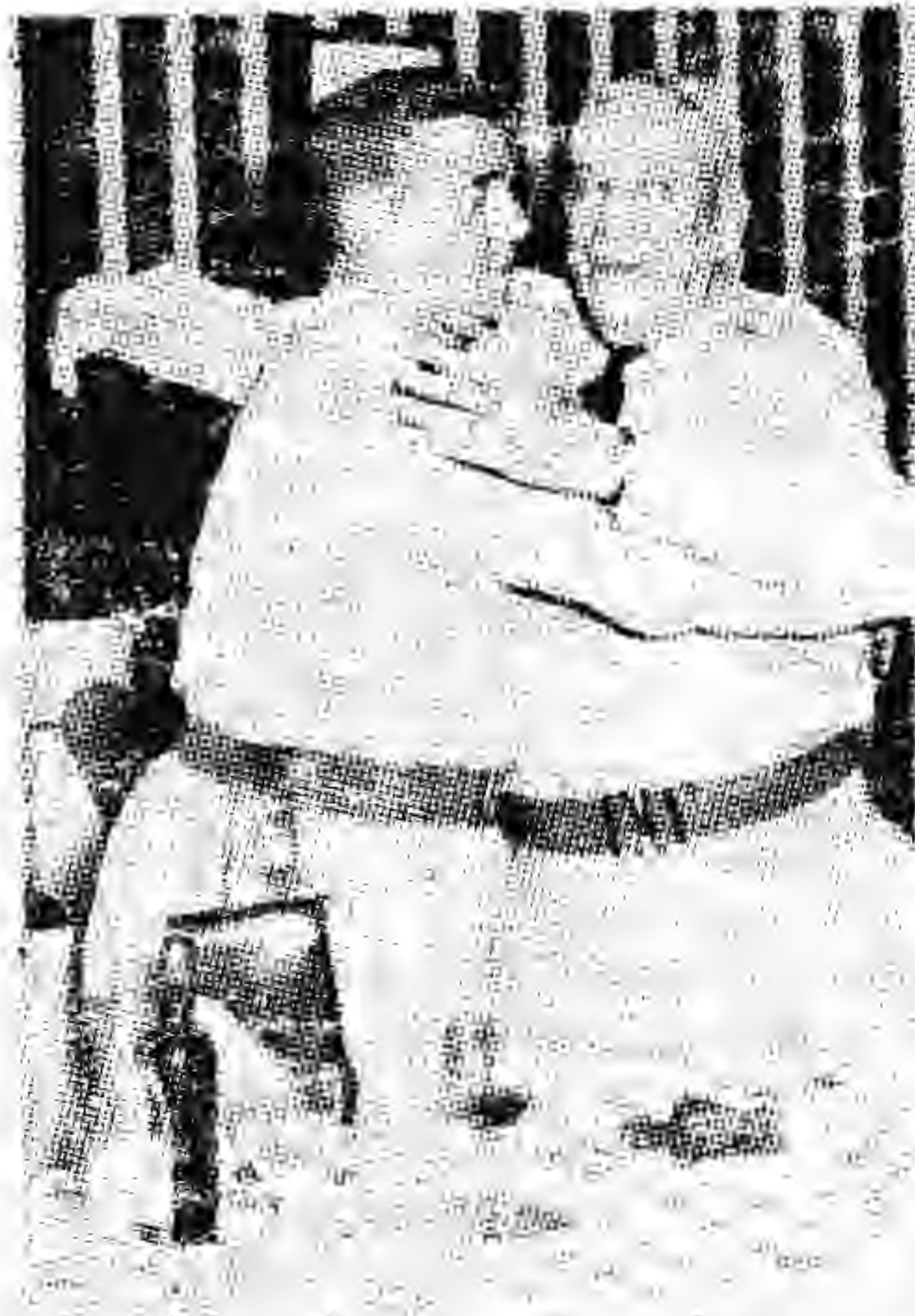
COWLEY, EL REPUGNANTE CHACAL DE HOLGUÍN ES FELICITADO POR SU JEFE TABERNILLA